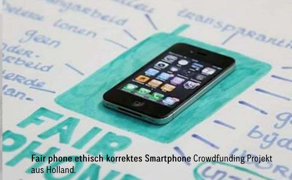
Fair phone ethisch korrektes Smartphone Crowdfunding Projekt aus Holland.